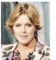
Il ministro Beatrice Lorenzin

«Inizieremo nuove campagne, anche all'interno delle università e anche tra i pediatri e i medici di medicina generale. Questo tema è nel programma europeo sulla "global health" in agenda per i prossimi cinque anni».