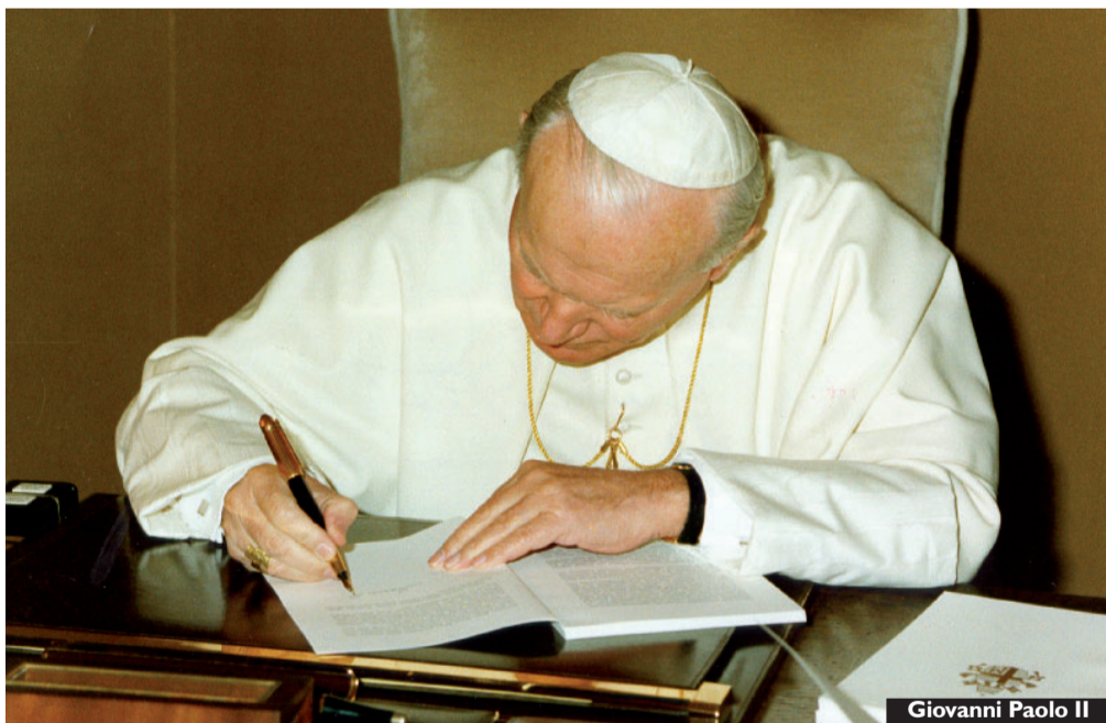
Giovanni Paolo II

Come si può non considerare squisitamente laico, urgente ed epocale tutto questo, la cui molla è unicamente la passione per ogni uomo indipendentemente dallo stadio in cui versa la sua vita? Lo confermano il preoccupante squilibrio demografico che investe l'Italia e l'intera Europa, nonché il progressivo invecchiamento della popolazione, che priva la società dell'insostituibile patrimonio che i figli rappresentano. Lo conferma la disponibilità a generare, ancora ben presente nella