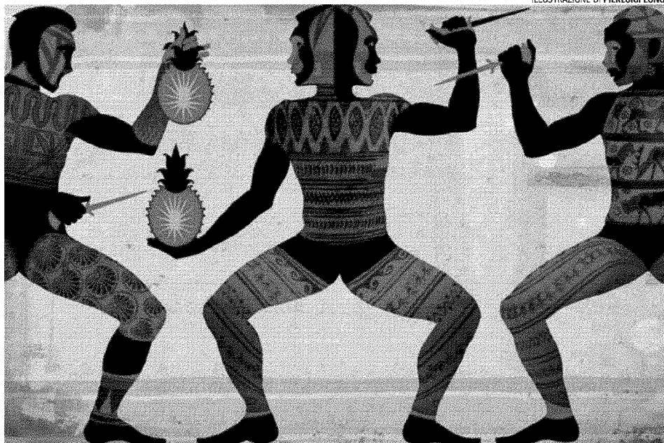
ILLUSTRAZIONE DI PIERLUIGI LONGO