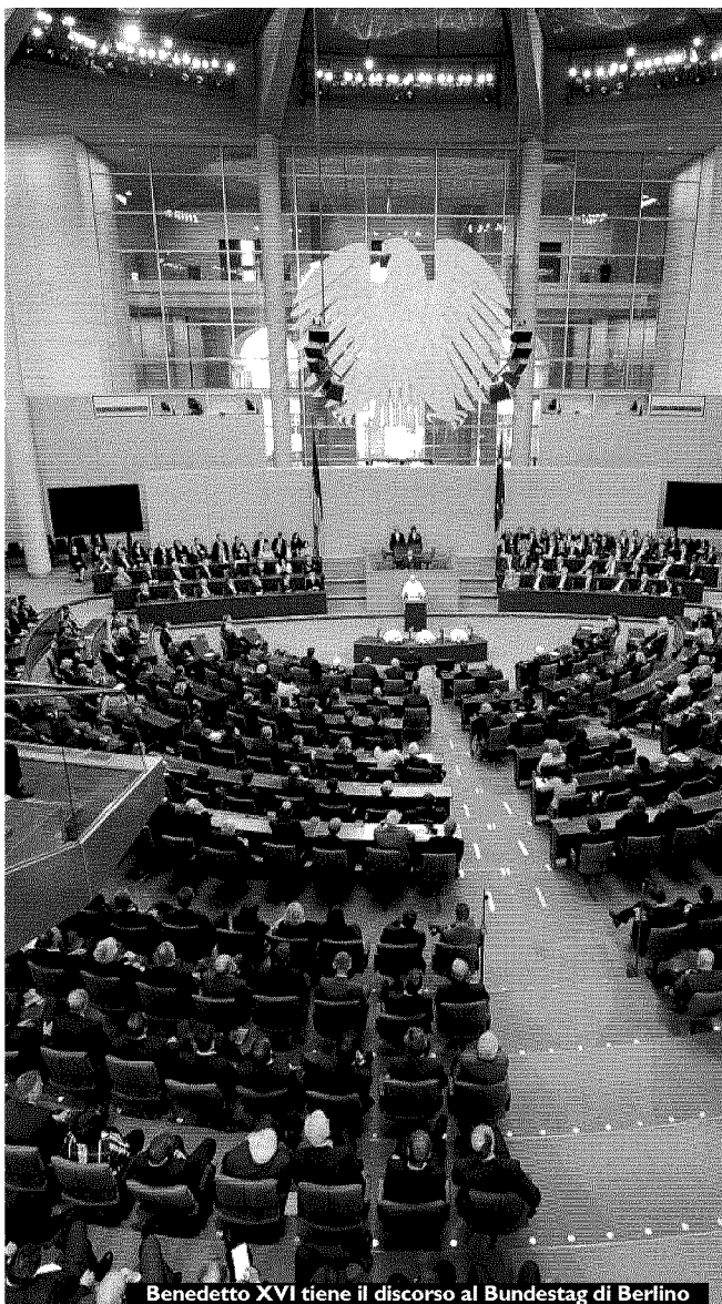
Benedetto XVI tiene il discorso al Bundestag di Berlino