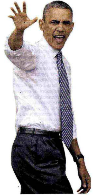
Una dimostrazione antiabortista a Washington. A sinistra, Barack Obama