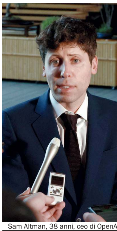
Sam Altman, 38 anni, ceo di OpenAI

I rischi della nuova intelligenza artificiale vengono dalla sua capacità di imitare qualunque fonte affidabile di informazione e conoscenza. I processi politici possono esserne influenzati in modo disastroso. Dobbiamo introdurre al più presto regolazioni e contromisure