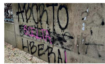
Le scritte sulla sede del Cav di Padova