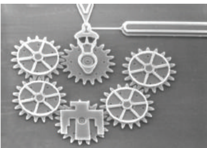
I nanomeccanismi entrano in competizione con i chip quantistici

Per ora possiamo ancora vivere sereni con la nostra stupidità naturale.