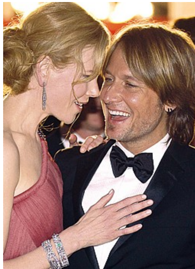
Nicole Kidman e Keith Urban prima di sposarsi nel 2006, hanno stabilito che se lui tornerà a fare uso di droghe o alcol e divorzieranno non riceverà nulla del patrimonio di 150 milioni di dollari della Kidman