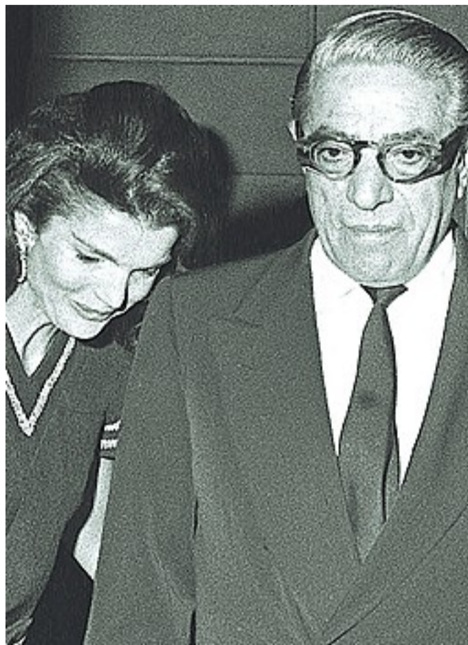
Jacqueline Kennedy e Aristotele Onassis prima delle nozze del 1968 stipularono un accordo di 22 pagine e 170 clausole in cui si stabiliva tutto: dal sesso al risarcimento da 25 miliardi in caso di divorzio