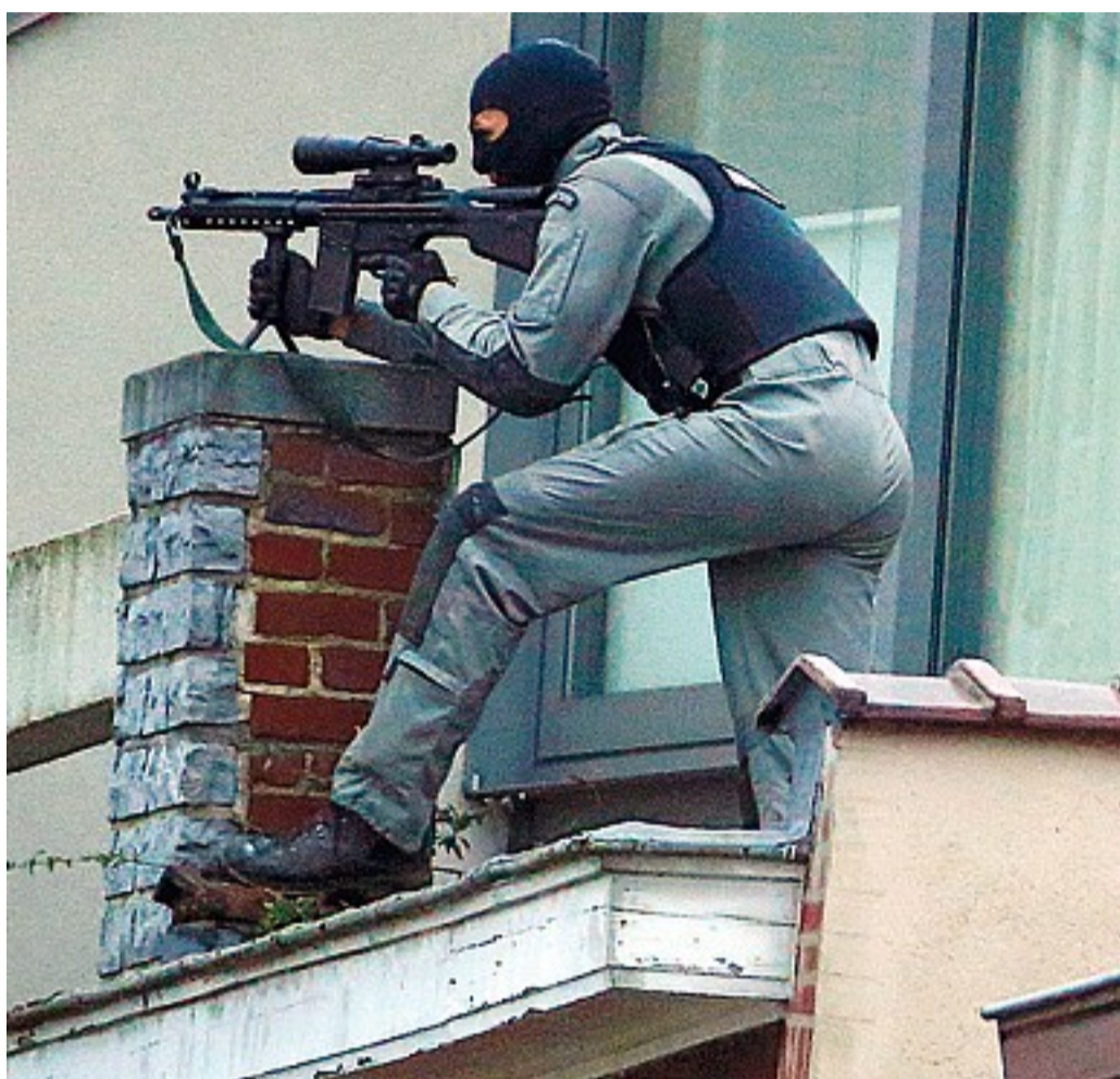
Un agente di polizia controlla la casa nel quartiere di Forest, a Bruxelles, dove è in corso il blitz antiterrorismo

Nel blitz ucciso un sospettato. Uno in fuga con le armi. Sotto assedio due asili