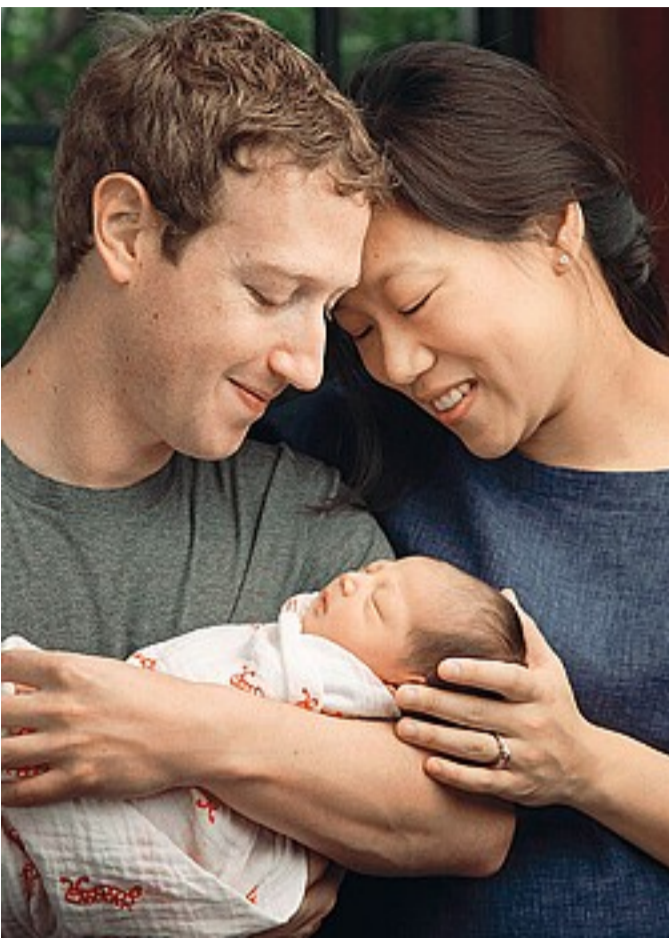
Mark Zuckerberg e Priscilla Chan prima del matrimonio nel 2012 hanno stipulato un accordo singolare: lui si impegna a fare sesso una volta a settimana ma in caso di divorzio terrà quasi tutto il patrimonio