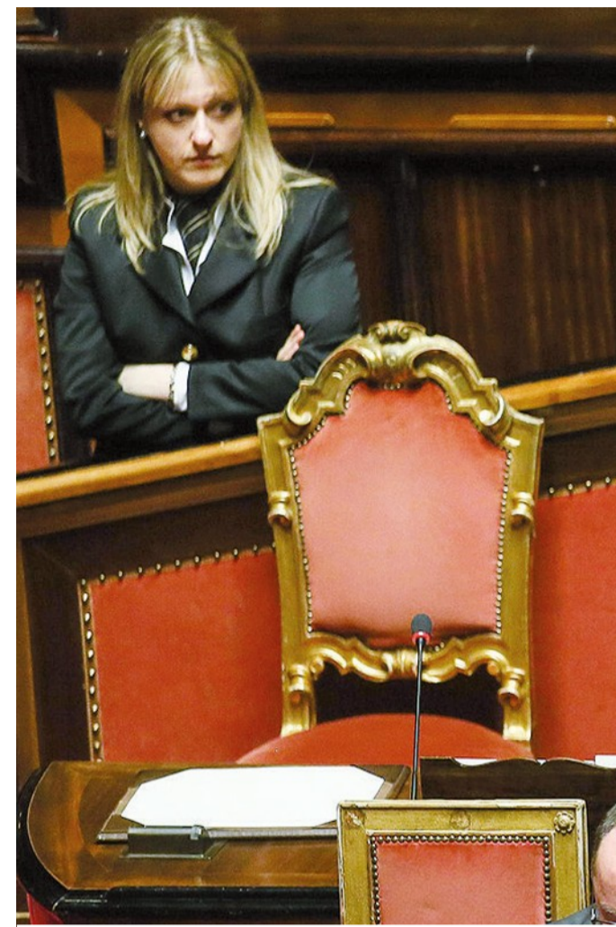
Il ministro delle Riforme, Maria Elena Boschi, chiede la fiducia.

«Sono lusingato, confuso, intimorito», dice presentandosi ai giornalisti subito dopo l'elezione all'unanimità, visto che la sola scheda bianca era la sua. Il «timore» nasce dal fatto che «prima dell'ingresso in Corte - dichiara Grossi - io ho fatto solo due cose: studiare e insegnare». Il neo presidente parla della Corte come di un organo che «deve aprirsi all'esterno», «un'emanazione della società civile» che «guarda ai principi fondamentali, espressi e inespresi, pensando ad annetterli al novero dei diritti del cittadino». Con le sue sentenze la Corte ha creato un «breviario». Perché sono «diritti fondamentali anche quelli che la Corte "inventa", nel senso latino di trovare, lavorando nelle trame della Costituzione». Il neopresidente tiene a mettere le cose in chiaro: «La Corte Costituzionale