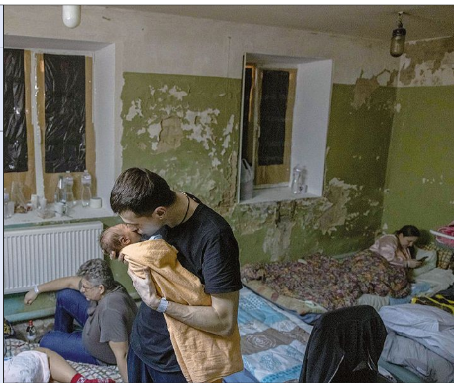
Un padre e il suo piccolo nel seminterrato di un reparto di maternità a Kiev

Giuseppe è padre di tenerezza. Così papa Francesco nella Patris corde . «Gesù ha visto la tenerezza di Dio in Giuseppe: "Come è tenero un padre verso i figli, così il Signore è tenero verso quelli che lo temono" (Sal 103,13). Giuseppe avrà sentito certamente riecheggiare nella sinagoga, durante la preghiera dei Salmi, che il Dio d'Israele è un Dio di tenerezza, che è buono verso tutti e «la sua tenerezza si espande su tutte le creature» (Sal 145,9)... È la tenerezza - scrive ancora il Papa - la maniera migliore per toccare ciò che è fragile in noi. Il dito puntato e il giudizio che usiamo nei confronti degli altri molto spesso sono segno dell'incapacità di accogliere dentro di noi la nostra stessa debolezza»