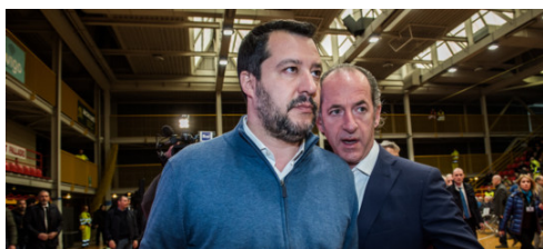
Salvini e Zaia