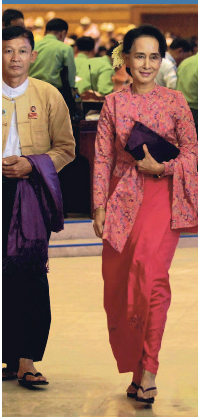
Aung San Suu Kyi alla prima seduta del Parlamento

Birmania, la svolta e la gioia “È l’era di Aung San Suu Kyi”