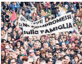
SERVIZI ALLE PAGINE 6 E 7

“No al voto segreto” Il Pd tira dritto sulle unioni civili