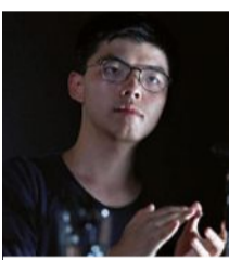
Joshua Wong / Epa

«A Hong Kong c'è una crisi umanitaria. La polizia spara sui cittadini, arresta giornalisti e infermieri, costringe gli studenti a rifugiarsi nelle università. Il mondo non può restare a guardare. Italia compresa. Dovete prendere posizione, appoggiare il nostro popolo, la nostra lotta per la democrazia». Joshua Wong non sembra sorpreso della decisione del tribunale di confermare il «no» al permesso di espatriare. È in attesa del processo di appello, in libertà provvisoria, ogni volta deve chiedere il permesso. A settembre, per andare in Germania, glielo diedero. Stavolta, per venire in Italia ospite della Fondazione Feltrinelli e ritirare un Premio, no. Negli ultimi due giorni sono state 1.100 le persone arrestate.