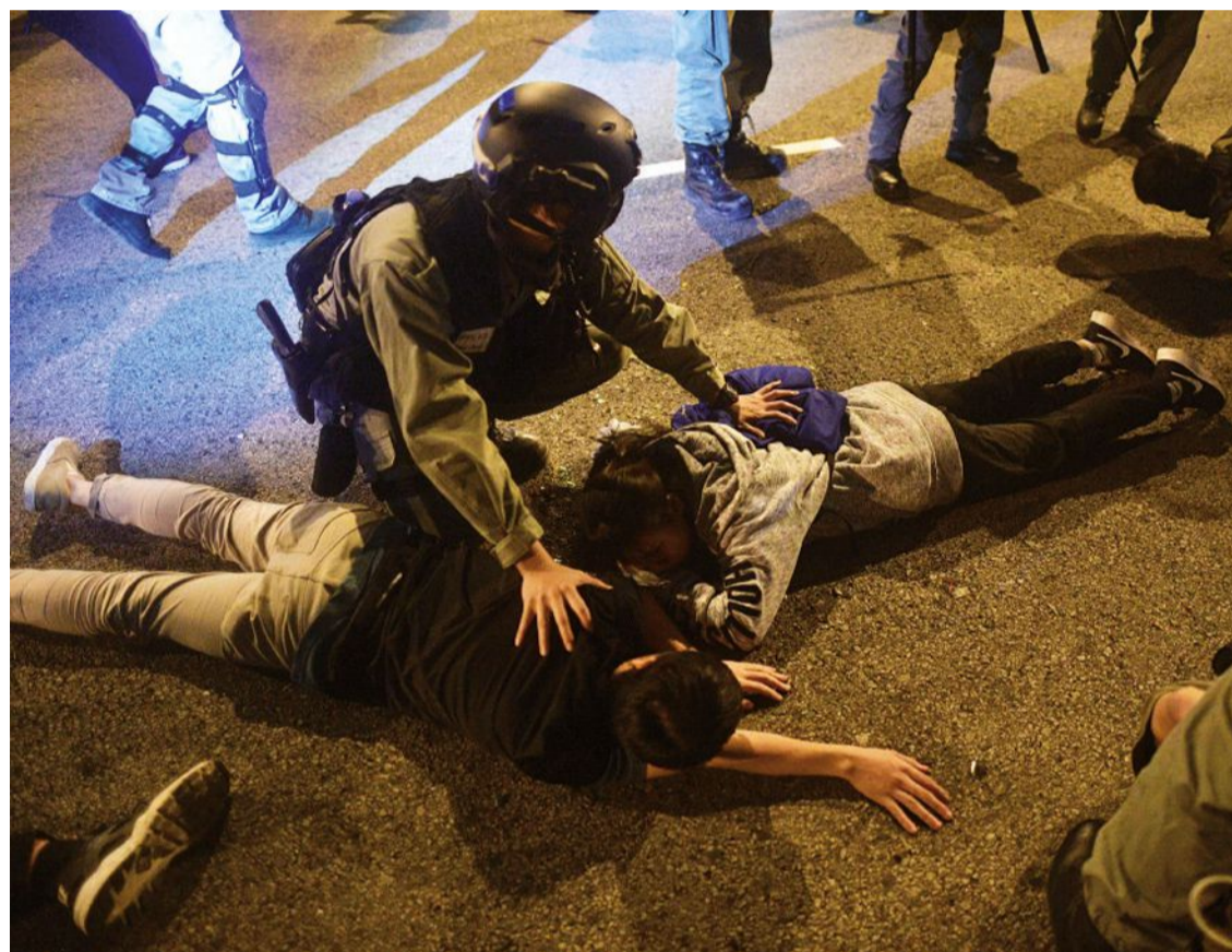
Vecchia alle pagine 4 e 5