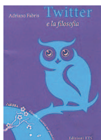
TWITTER E LA FILOSOFIA di Adriano Fabris EDIZIONI ETS, PP. 63, EURO 10