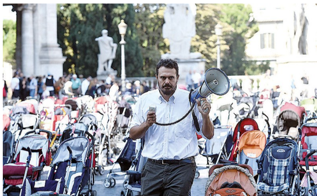
De Palo il 4 ottobre del 2014, durante la manifestazione dei "passeggini" in Campidoglio

to un Parlamento capace di confrontarsi con rispetto, di mettere da parte piccole convenienze, di guardare a quello che sarà tra dieci anni e non tra dieci giorni. Lei non sa quante volte mi sono chiesto perché alzare un muro per negare diritti civili alle coppie omosessuali. Mi sono fatto domande dure. Impegnative. Domande che hanno scosso amicizie. Ma, parallelamente, mi sono anche chiesto perché questa forzatura sulle adozioni, perché non pensare mai ai più deboli, mai ai bambini, mai alle famiglie che restano indietro, mai alle donne umiliate da una pratica disumana come l'utero in affitto». Una pausa leggera. «Sarò al Circo Massimo con molte associazioni del Forum per questo. Per dire "è il momento di proteggere" famiglie e bambini. E per segnalare le troppe ambiguità del ddl Cirinnà». Se la legge passasse così com'è vede dei rischi? Il pericolo è ferire un'Italia che oggi ha un disperato bisogno di coesione e di concretezza. Via i muri, via le rigidità ideologiche, via le asprezze, via le tifoserie. È ora di far prevalere la ragionevolezza, il buon senso. Di costruire, di pensare al Paese e dunque di essere rispettosi di principi e di sensibilità di una parte e dell'altra. Io continuo a fare con tenacia il mio lavoro: parlare di famiglia perché credo che salvare la famiglia vuol dire salvare l'Italia. Vuol dire aiutarla