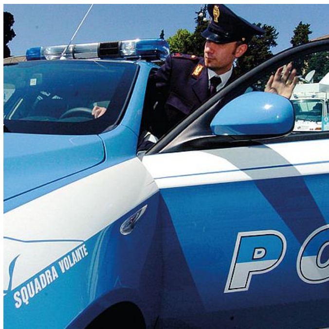
Una pattuglia della polizia

Soltanto che, quando gli agenti della squadra mobile sono entrati nella casa in affitto dell'africano, hanno trovato nel soggiorno una nigeriana di 20 anni, residente a Bologna, seminuda e distesa sul lettino, con un asciugamano che le copriva le parti intime. Il "dottor Prince" non aveva ancora iniziato la sua opera. Nella casa sono stati trovati e sequestrati gli strumenti chirurgici usati dai medici per interrompere la gravidanza nelle sue varie fasi: fino all'ottava